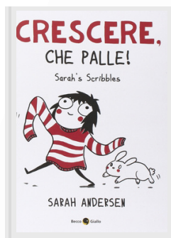
CRESCERE, CHE PALLE! Sarah Andersen BeccoGiallo, 2020

Storie di venti donne che hanno rivoluzionato il mondo della musica, da Dorothy Parker a Mavis Staples, passando per Patti Smith e Miriam Makeba. Per ispirare le giovani generazioni di futuri musicisti. (Da 11 anni)