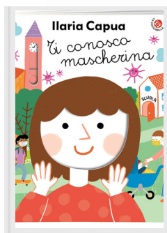
TI CONOSCO MASCHERINA Ilaria Capua La Coccinella, 2020

Trovare un buon vicinato è cosa molto difficile, c'è sempre qualcuno che si lamenta, e in questo palazzo di pecore la situazione non è diversa. Ma pian piano le cose cambiano e pagina dopo pagina il palazzo si trasforma davanti ai nostri occhi, come se rimanessimo seduti sulla stessa panchina attraverso le stagioni (della vita). (Dai 3 anni)