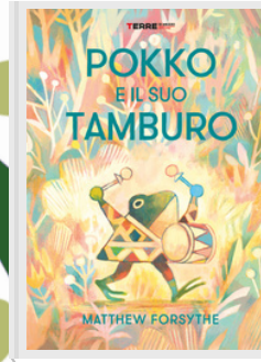
POKKO E IL SUO TAMBURO Matthew Forsythe Terre di Mezzo, 2020

Julian è un topolino dalla vita tranquilla e programmata, basata sull'evitare gli altri per non avere problemi. La cosa cambia però quando dal nulla una volpe si incastra sull'ingresso della sua tana, non certo mossa da buone intenzioni! Pian piano però tra i due nasce una situazione inaspettata... non è così male avere qualcuno a cena. (Dai 4 anni)