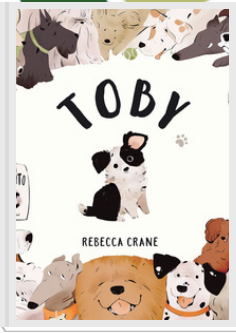
TOBY Rebecca Crane Lapis edizioni, 2020

Anche i cagnolini possono farsi domande su chi sono e smarrirsi nel trovare risposte... Sono un cane grande, ma c'è qualcuno che lo è di più; sono veloce, ma non abbastanza, loro sono schegge; sono pelosissimo, ma lui lo è molto di più! Forse chi ci vuole veramente bene va oltre a questi paragoni e ci vede con occhi molto diversi dai nostri e soprattutto speciali. (Dai 3 anni)