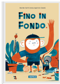
FINO IN FONDO Davide Cali, Anna Aparicio Català Kite Edizioni, 2020

Caspar finirà mai qualcosa nella sua vita? Scimmietta dalle molte passioni, non ha ancora concluso nulla... prendere un aereo per un lungo viaggio, scrivere un libro, dipingere. Una cosa però la finirà, e non se ne accorgerà neanche. (Dai 6 anni)