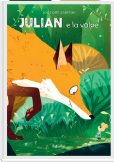
JULIAN E LA VOLPE Joe Todd-Stanton Babalibri, 2020

Julian è un topolino dalla vita tranquilla e programmata, basata sull'evitare gli altri per non avere problemi. La cosa cambia però quando dal nulla una volpe si incastra sull'ingresso della sua tana, non certo mossa da buone intenzioni! Pian piano però tra i due nasce una situazione inaspettata... non è così male avere qualcuno a cena. (Dai 4 anni)