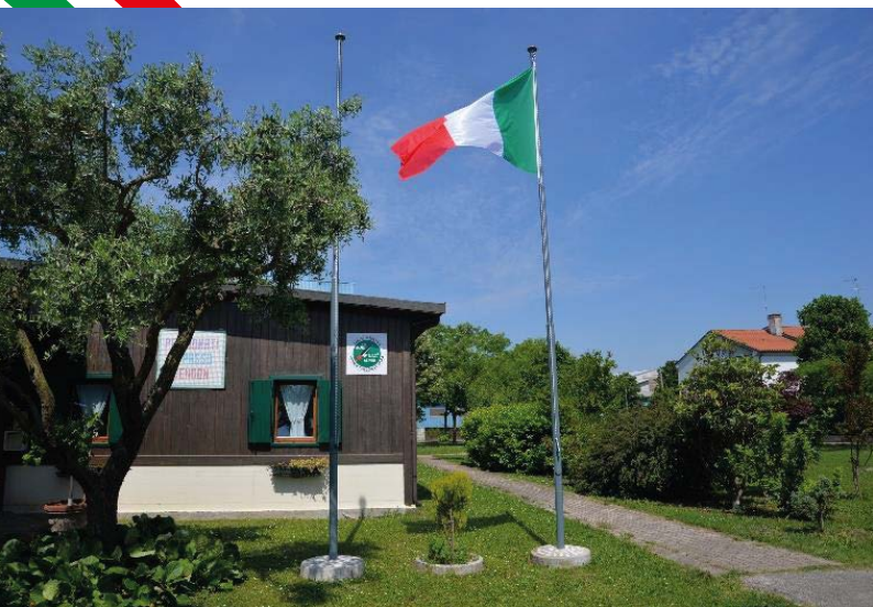
SEDE DEL GRUPPO DI VIA CÀ MEMO, 12 CENDON DI SILEA