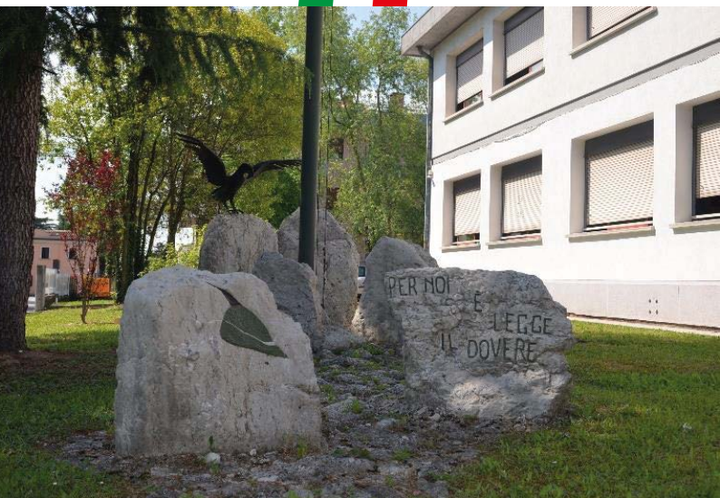
MONUMENTO ALL'ALPINO DI VIA TEZZE SILEA