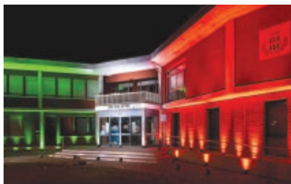
Il tricolore illumina gli edifici simbolo del paese. Questi effetti sono il risultato della collaborazione con la fotografa Federica Donadi, il fotografo Andrea Spera e Cilona Service di Lorenzo Cilona.