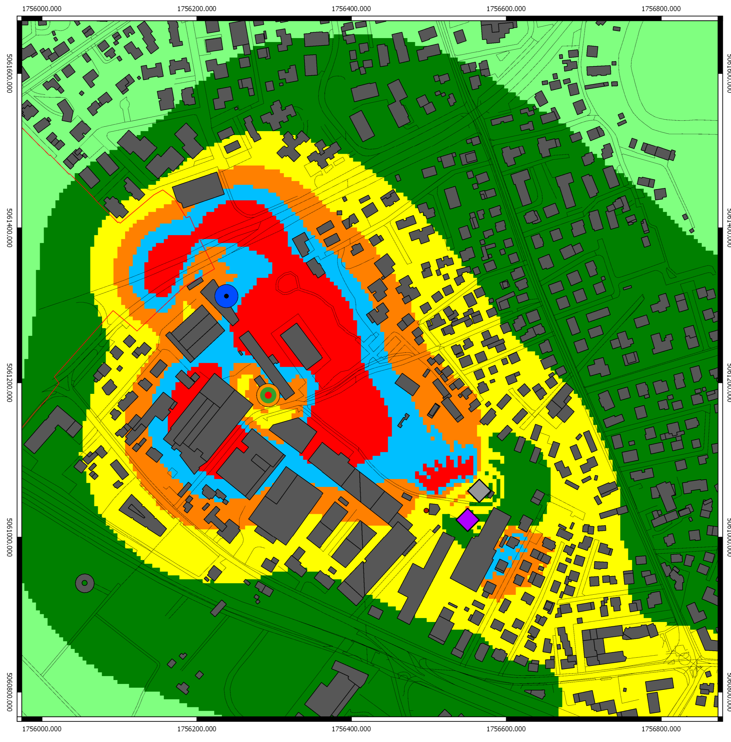
Campo elettromagnetico (V/m) calcolato alla quota di 16,3 m sul livello del terreno