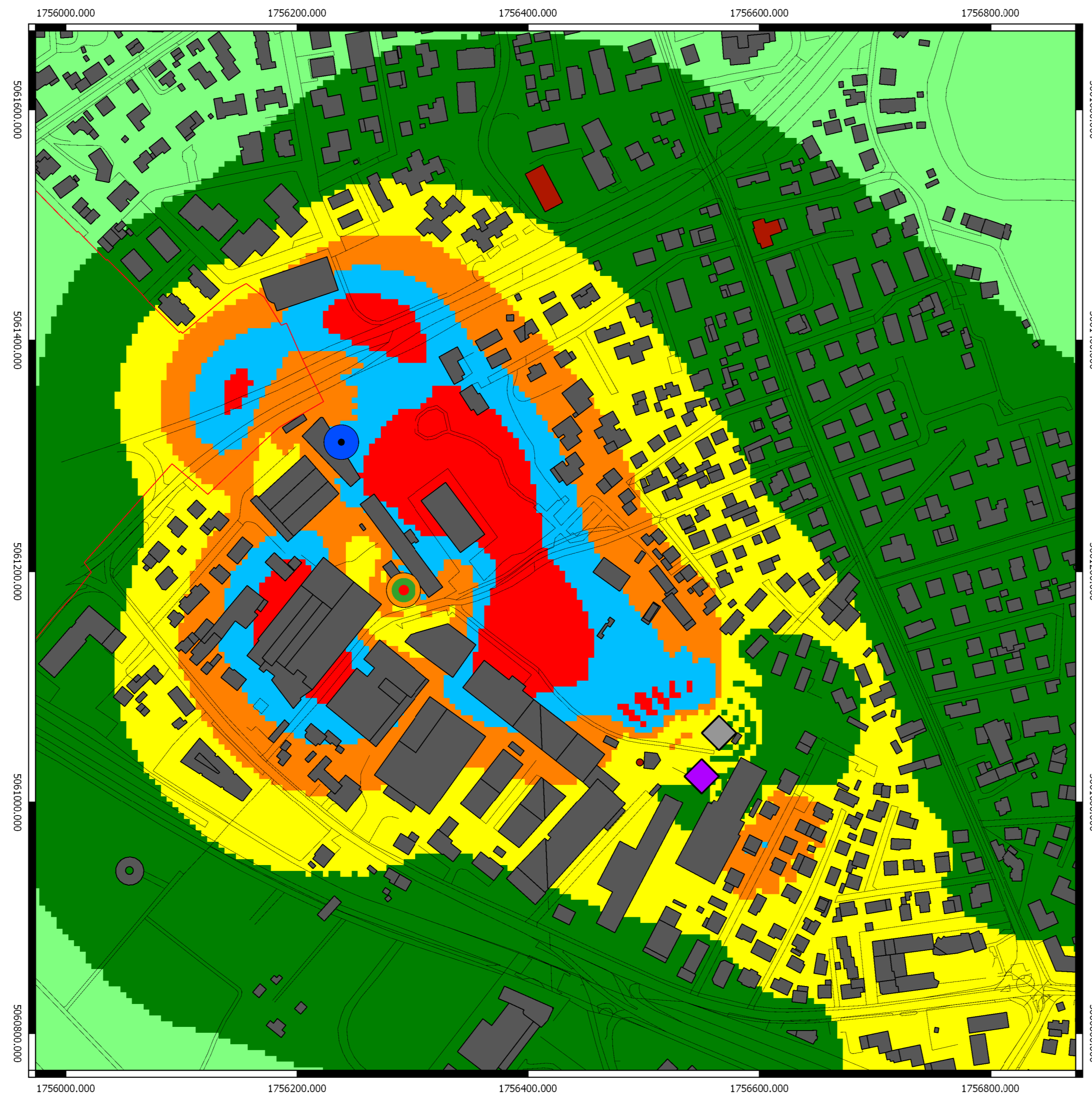
Campo elettromagnetico (V/m) calcolato alla quota di 14,3 m sul livello del terreno

Note In questa tavola sono rappresentate le aree all'interno delle quali è stato calcolato un valore di intensità di campo elettromagnetico superiore a 1,8 V/m. L'edificio più alto all'interno dell'area comunale ha gronda pari a 21,3 m st. Sono state individuate 6 aree di dettaglio, nella presente tavola viene rappresentata l'area di dettaglio n° 1. Area di dettaglio 1: in prossimità degli impianti WindTre TV675, Vodafone TV5046-B, Tim TW17_e e Iliad TV31100_020. Sono stati considerati due siti di progetto: -Futura espansione in nuova posizione con centro elettrico pari a 30 m st. -Opnet in nuova posizione con centro elettrico pari a 26,45 m st. Il valore massimo di campo elettromagnetico calcolato in funzione dell'altezza degli edifici in tutta l'area di dettaglio è di circa 5,5 V/m. La futura espansione è stata simulata utilizzando antenna omnidirezionale con 2° di tilt meccanico. Opnet è stata simulata utilizzando una configurazione già presente a catasto ARPAV in stato "parere favorevole non comunicato". L'edificio più alto all'interno dell'area di dettaglio in oggetto è quotato 14,3 m st. Sarà cura di ARPAV verificare eventuali superamenti a seguito della presentazione del progetto definitivo da parte dei gestori interessati.